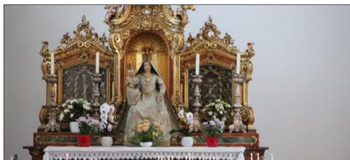
Les pèlerins sont moins nombreux depuis le début de la pandémie. Mais l'abbaye, avec son projet Mariastein 2025, veut préparer l'avenir.