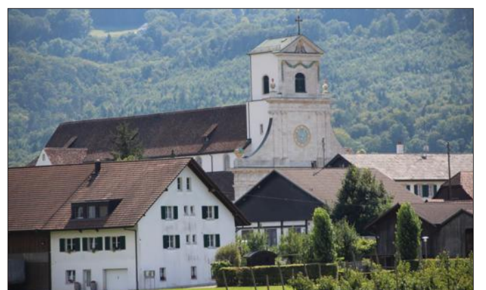
C'est ainsi que le pèlerin découvre Mariastein en venant à pied depuis Leymen.

Mais les moines ont reconstitué une bibliothèque, ramenée à Mariastein lors de leur retour en 1971 ; elle a été enrichie par celle des moines d'Altdorf à leur arrivée en 1981... Sans compter, l'année suivante, les livres de celle de Brégenze, siège des moines de Mariastein de 1906 à 1941. Et ce n'est pas tout, car... L'ancienne bibliothèque elle-même, celle d'avant 1874, a été rétrocédée dans le cadre d'une convention en 1998. On y trouve, notamment, certains volumes de l'abbaye de Lucelle. Ainsi la boucle sera bouclée !