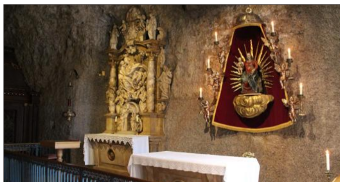
Au cœur du sanctuaire marial, la grotte du miracle.