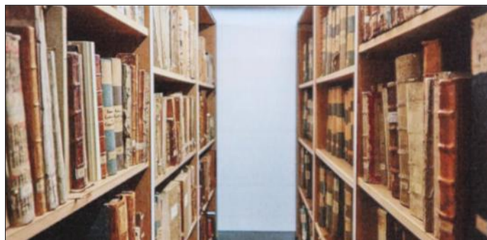
Autre projet pour les années à venir : redonner tout son éclat à la bibliothèque de l'abbaye, dont les 180 000 volumes ont une histoire riche et mouvementée.

L'objectif du chantier, c'est d'assurer à la bibliothèque de 180 000 volumes aujourd'hui un espace sûr et adéquat pour les prochaines décennies, un système de classement fiable pour qu'elle puisse se développer. Il faut donc de la place, avec des