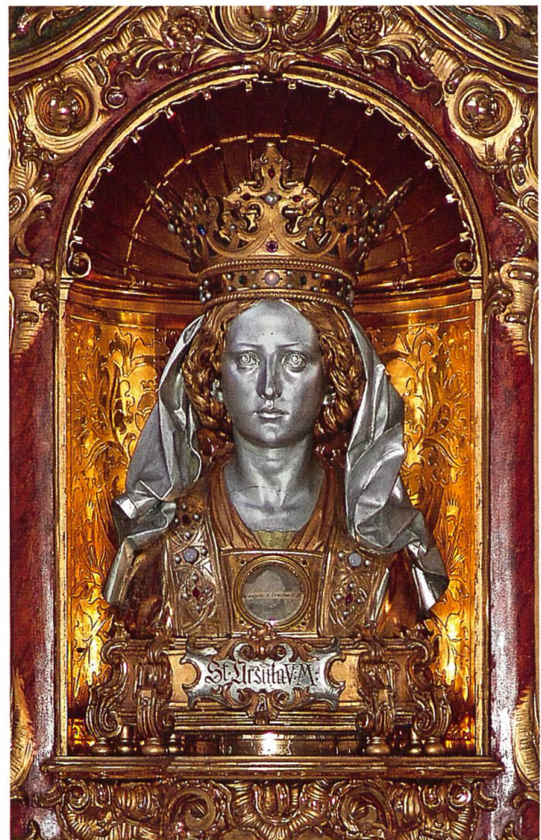
Kopfreliquiar der hl. Ursula im Ursula-Altar des linken Seitenschiffs der Basilika.

Reliquiare sind gleichsam die Gehäuse für die Reliquien. Was heute beachtet und bewundert wird, war für die damalige Zeit Nebensache. Hauptsache war und ist die Reliquie darin, nicht das kostbare und heute von der Kunstgeschichte so hoch geschätzte Auf-