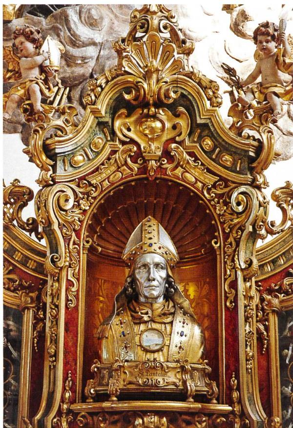
Kopfreliquiar des hl. Pantalus im Pantalus-Altar.

hat auch etwas zu tun mit dem Glauben an die leibliche Auferstehung der Toten. Zudem glaubt man, dass in den Reliquien von Heiligen auch ihre Wirkkraft und ihre Nähe durch ihre Fürbitte irgendwie gegenwärtig sind. Bitte, verwechseln wir Verehrung nicht mit Anbetung! Zugegeben, mit dem Reliquienkult wurde früher auch Aberglaube und Missbrauch getrieben. Es gab im Mittelalter riesige Sammlungen von Reliquien. Ein Beispiel: Geradezu suchtartig sammelte Friedrich der Weise (gest. 1525), Luthers Beschützer, Reliquien. 1520 soll seine Sammlung 18970 Stücke umfasst haben, verbunden dann auch noch mit Ablässen von 1902202 Jahren. Dass gerade Luther einen solch abwegigen Reliquienkult ablehnte, ist verständlich. Das Reformkonzil von Trient erliess dann auch 1563 neue Richtlinien für eine theologisch verantwortbare Reliquienverehrung.