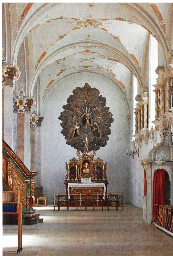
Der Pantalus-Altar befindet sich im rechten Seitenschiff der Basilika.