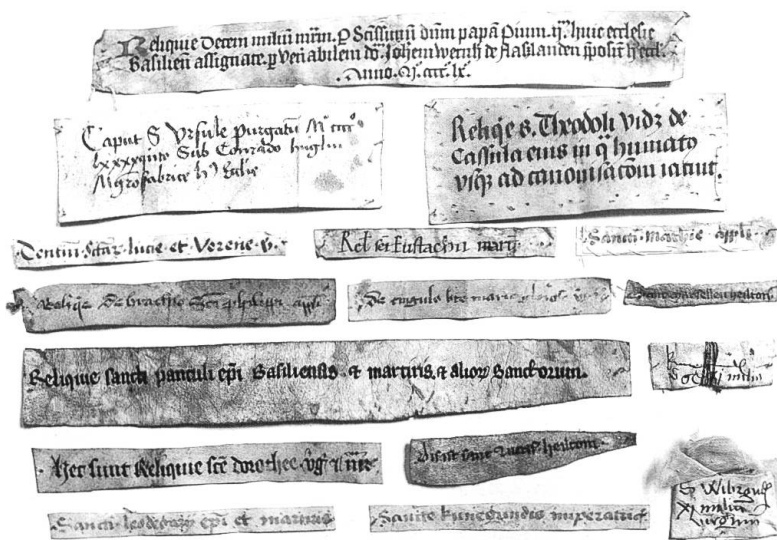
Authentiken zu einigen Basler Reliquien.

bewahrungsgefäss. Ein extremes Beispiel: Die Ste-Chapelle in Paris wird als gotische Kirche hochgeschätzt. Sie wurde geschaffen für die Aufbewahrung der Dornenkrone Jesu; sie ist also gleichsam das «Reliquiar» für die Dornenkrone. Die Dornenkrone – echt oder unecht, sei dahingestellt – fand jetzt wieder Erwähnung beim Brand der Kathedrale von Paris, wo sie heute aufbewahrt wird und vor der Vernichtung gerettet wurde.